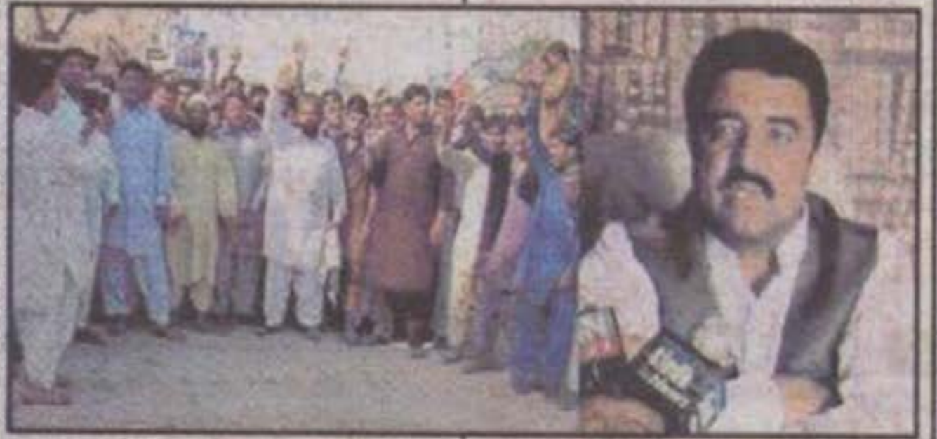
مدئجي: گاڏين کان ٽيڪس وٺڻ خلاف ٽرانسپورٽرن احتجاج ڪري رهيا آهن