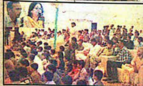
سکر دورہ علمی و ادبی کی جانب سے منعقد کیے گئے سہ ماہی اجتماع کے شرعی خطاب کے سہ ماہی ہیں

جلد 99 ہفتہ 18 جمادی الثانی 1438 بمطابق 18 مارچ 2017 نمبر 77