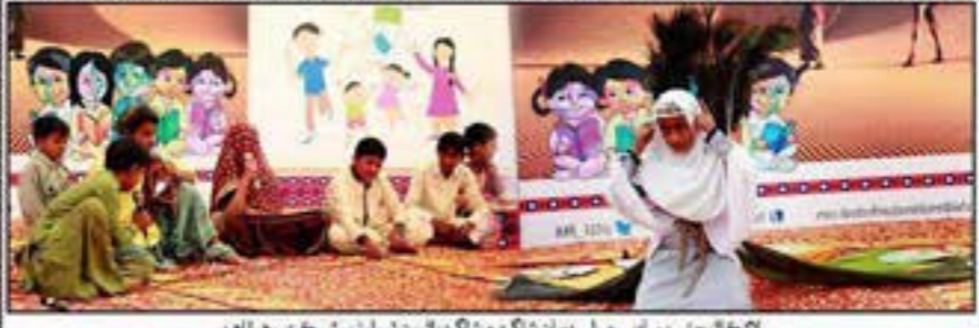
لاڙڪاڻو: مٿي ۽ ونگايل ادبي ميلي دوران شاگرد ۽ شاگردن پيش ٿيل ميلو پيش طهري رهيا آهن.

مٿي جو علائقو پيشي هجڻ باوجود ٻارن تعليم جي ميدان ۾ اڳتي اچي ثابت ڪيو آهي ته تعليم سهولتن جي محتاج نه هوندي آهي. نصير جوڳي لاڙڪاڻو انسٽيٽيوٽ رپورٽر اداره تعليم ۽ آگاهي لڳايو ويو تعليم کاتي جي تعاون سان لڳايل جي مختلف سرهڙي ۽ خانگي اسڪولن جي 5 طرفان مٿي ۽ ونگايل لاءِ ٻن ڏينهن وارو ادبي ميلو. ميلي ۽ عمر طهري، ننگر پارڪر ۽ اسلام آباد طرفان هزار کان وڌيڪ ٻارڙن اٺسو صحر 3 هفتلر 8